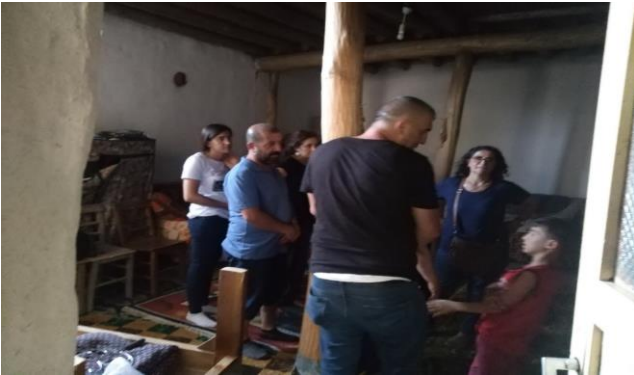
Görsel 6. Misafirlerin fesin sürülmesi ritüelini beklemeleri (Emrah Tüncer, 12 Temmuz 2018)

Kadın, erkek, çocuk, Alevi, Sünni gibi kimlik ve farklılıkların ortadan kalktığı odada herkes sıraya girerek önündeki ritüelin bitmesini bekler (Görsel 6). İnsanlar bu etkinlik içinde olağan sürenin ve sosyal yapıların dışına çıkarlar burada her zaman karşılaşılan hiyerarşik yapı büyük oranda ortadan kalkar ve farklı bir toplumsal yapı meydana gelir.