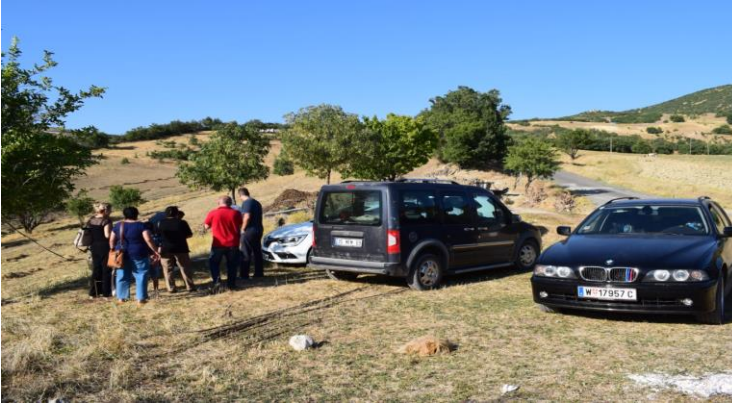
Görsel 1. Çori Bori ziyaret evine yurtdışından gelen yabancı plakalı araçlar (Emrah Tuncer, 12 Temmuz 2018)