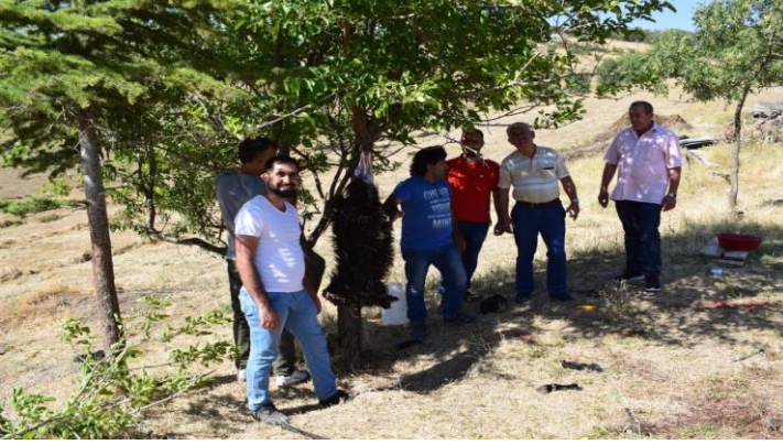
Görsel 2. Çori Bori ziyaret evinde kurban kesimi (Emrah Tuncer, 12 Temmuz 2018)

Ziyaret evi ve ahırın hemen arkasındaki arazide kurban kesilir. Her ne kadar gelen misafirlerin yardımcı olduğu görülse de kurbanın kesilmesi, postunun çıkarılması, bölünmesi işlemi genelde türbe sahibi M.A. tarafından gerçekleştirilmektedir (Görsel 2). Kesilen genelde küçükbaş hayvan olmasının yanında maddi durumu elvermeyenler kümes hayvanlarını da kurban edebilmektedirler.