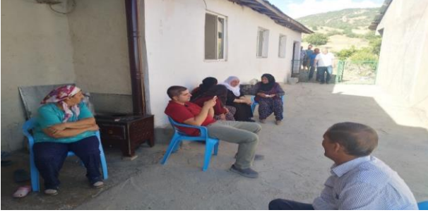
Görsel 4. Çori Bori ziyaret evinin önünde oturan misafirler (Emrah Tüncer, 12 Temmuz 2018)

Yemek yedildikten sonra ev sahibi tarafından evin bir odasında çıkartılan yeşil beze sarılı kutsal fes, sıraya giren ve sırası gelen herkesin vücuduna sürülür (Görsel 5) . Mırıldanan dualar ve istekler eşliğinde kutsalı üç defa öpüp başına koyan kişi tekrardan dışarıya diğer misafirlerin yanına gider. Komünitas açısından en belirgin durum bu andır.