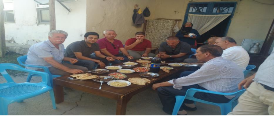
Görsel 3. Çori Bori ziyaret evinde pişirilen kurban etinin misafirlere sunulması (Çiğdem Tüncer, 12 Temmuz 2018)

Parçalara ayrılan bu etler ise genelde bu evde oturan M.A.'nin annesi, eşi ve ziyarete gelen diğer kadınlar tarafından sacda kavrularak misafirlere pilav ve salata ile ikram edilir (Görsel 3). Kesilen kurban eti eğer çoksa ve artmışsa aynı zamanda her misafire evine götürmek üzere verilir.