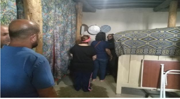
Görsel 5. Çori Bori ziyaret evine şifa bulmaya gelen ziyaretçilere ev sahibi tarafından fesin sürülmesi ritüeli (Emrah Tüncer, 12 Temmuz 2018)

Yemek yedildikten sonra ev sahibi tarafından evin bir odasında çıkartılan yeşil beze sarılı kutsal fes, sıraya giren ve sırası gelen herkesin vücuduna sürülür (Görsel 5) . Mırıldanan dualar ve istekler eşliğinde kutsalı üç defa öpüp başına koyan kişi tekrardan dışarıya diğer misafirlerin yanına gider. Komünitas açısından en belirgin durum bu andır.